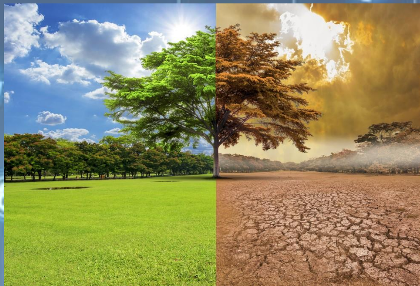
Frenar el cambio climático