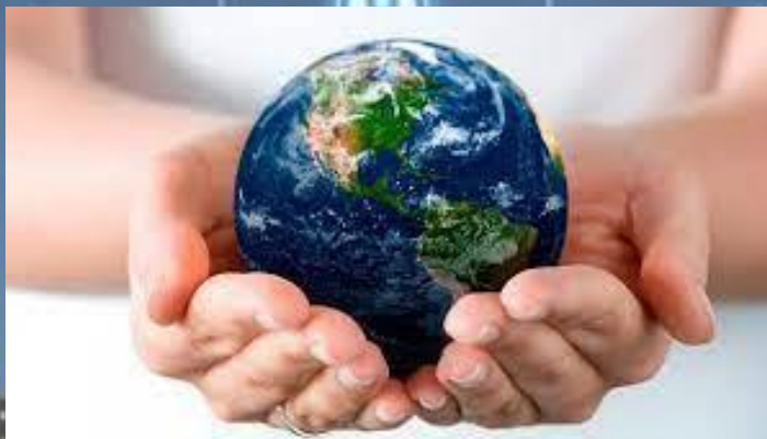
Proteger el planeta

La sostenibilidad trata de proteger el planeta, frenar el cambio climático e impulsar el desarrollo social sin que pongamos en riesgo la vida sobre la Tierra y sin dejar a nadie atrás.