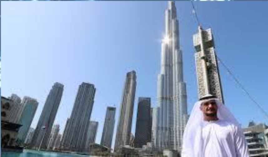
La Torre Burj Khalifa. En Emiratos Árabes Unidos.

Dichas modalidades de consumo deberán ser acordes con sus propias condiciones territoriales, geográficas, sociales, económicas y culturales.