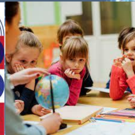
A la Educación