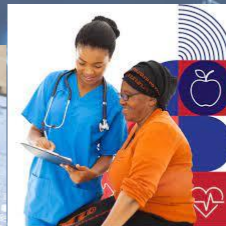
A la Salud