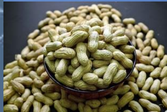
Cascara de maní.