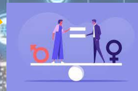
Igualdad de genero