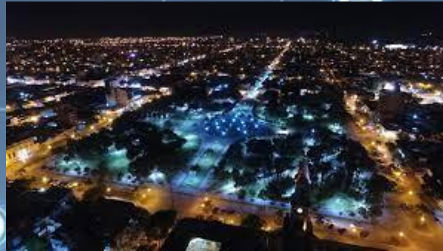
Ciudad de Reconquista