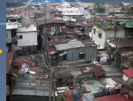
Condiciones de vida