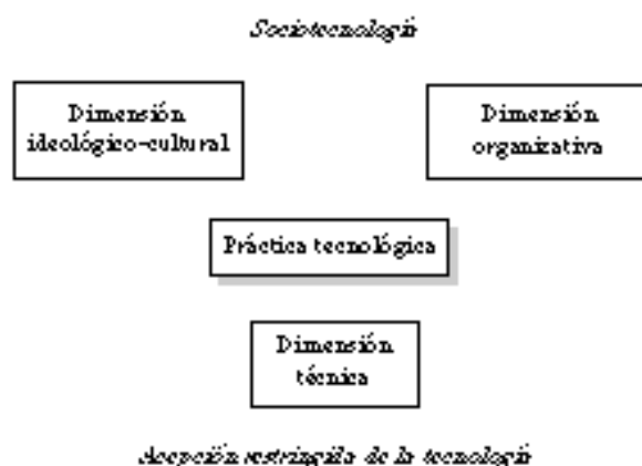
Cuadro 1 Modelo conceptual de la tecnología según Pacey (1983).

Pacey (1983) propone que el análisis, la valoración y la gestión de la tecnología se haga tomando como referencia las tres dimensiones en su conjunto, ya que los cambios en aspectos de cualquiera de ellas pueden producir ajustes y modificaciones en los de las otras dos. Además, mientras que las concepciones de la tecnología restringidas a la dimensión técnica tienden a proponer soluciones exclusivamente técnicas a los problemas tecnológicos de interés social, Pacey considera que muchas de las soluciones a los mismos dependen en mayor grado de cambios en los aspectos del ámbito sociotecnológico, esto es, de las dimensiones organizativa e ideológico-cultural. Sin duda, esta otra forma de abordar los problemas tecnológicos que afectan a la sociedad puede favorecer la participación social para su resolución, por lo que es probable que las soluciones lleguen a estar más de acuerdo con los deseos e intereses de los ciudadanos.